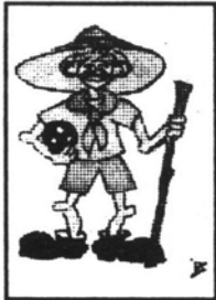
Bak Sára rajza

L.Zs.: Nagyon jól telt, jobb volt, mint a nagy tábor. Órszűk, összeszokott, látszik, hogy már tapasztalatunk van.