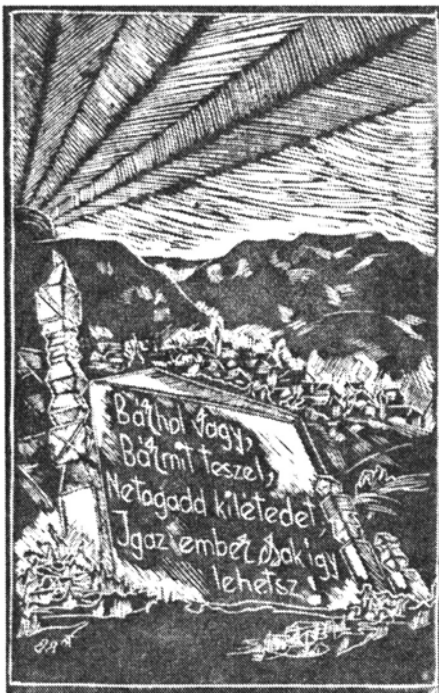
Tamási Árpád: Linómetszet