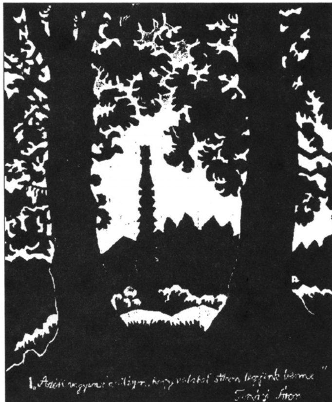
„Tamási Áron őrizői” linómetszet - Farkaslaka, Jakab Zs.